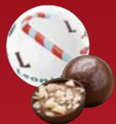
Bola de Navidad praliné chispeante chocolate negro