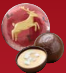
Bola de Navidad castañas del Mont Blanc chocolate negro