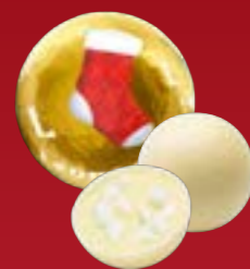
Bola de Navidad merengue limón chocolate blanco

Descubre nuestra nueva colección ampliada de bolas de Navidad. Ahora incluye 13 deliciosas bolas, gracias a la incorporación de 5 nuevos y exquisitos sabores a nuestra selección. Cada bola es una pequeña obra maestra, perfecta para las celebraciones de fin de año. Tanto si las regala como si las disfruta con sus seres queridos, aportarán un toque mágico y delicioso a sus fiestas de fin de año.