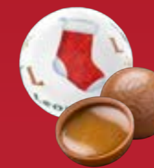
Bola de Navidad caramelo salado chocolate con leche