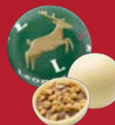
Bola de Navidad praliné avellanas chocolate blanco