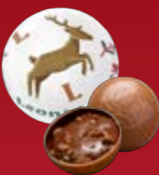
Bola de Navidad brownie chocolate con leche