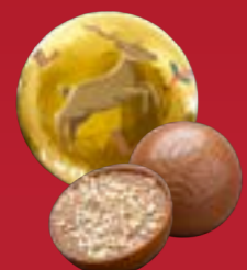
Bola de Navidad praliné con galleta chocolate con leche