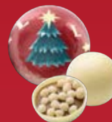
Bola de Navidad praliné arroz inflado chocolate blanco