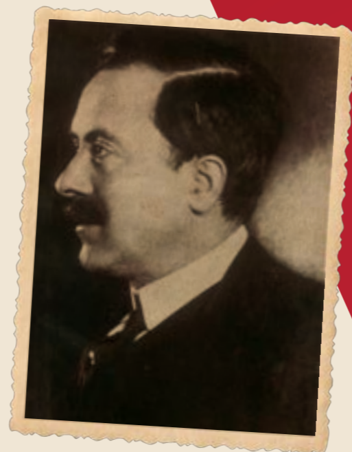
Leonidas Kestekides Fundador de Leonidas

La misión de nuestra empresa sigue siendo la misma que la estableció nuestro fundador. Desde 1913, Leonidas ha compartido generosamente su pasión por crear los chocolates y productos de chocolate más deliciosos.