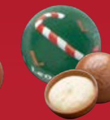
Bola de Navidad vainilla chocolate con leche