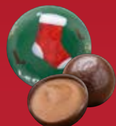
Bola de Navidad praliné chocolate negro