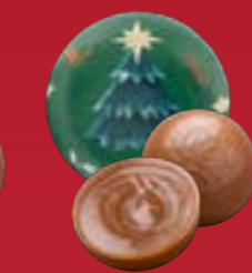
Bola de Navidad pasta de avellanas chocolate con leche