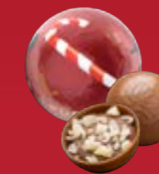
Bola de Navidad praliné chispeante chocolate con leche