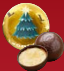
Bola de Navidad crema crème brûlée chocolate negro